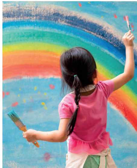
Crèche - Écoles