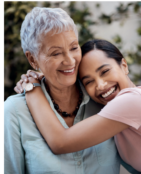
Services Pharmacie Médecins, vétérinaire